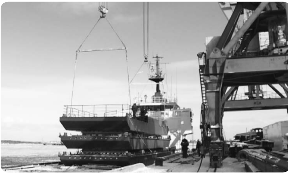
Выгрузка понтонного моста в Нарьян-Марском порту

Понтонный мост Нарьян-Мар – Тельвиска, как детский конструктор – состоит из нескольких деталей, которые собираются в единую конструкцию. Вот только габариты совсем не игрушечные. Весит каждая из шести деталей